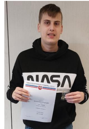
Einzel Junior II