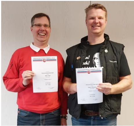
Einzel Herren II