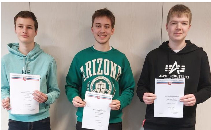
Einzel Junior II