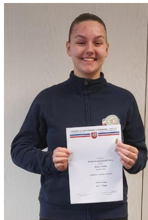
Einzel Juniorinnen II