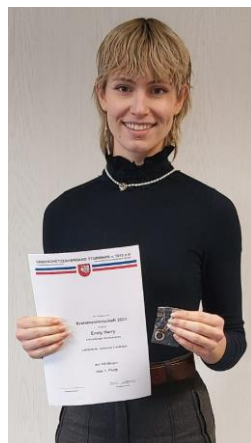
Einzel Juniorinnen I