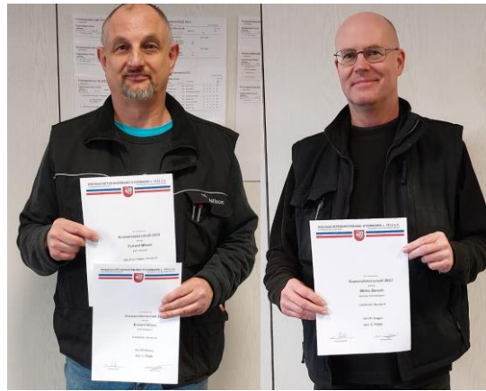
Einzel Herren III