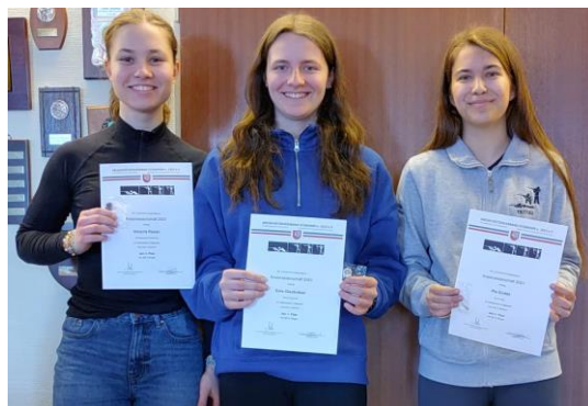
Einzel Junioren II weiblich